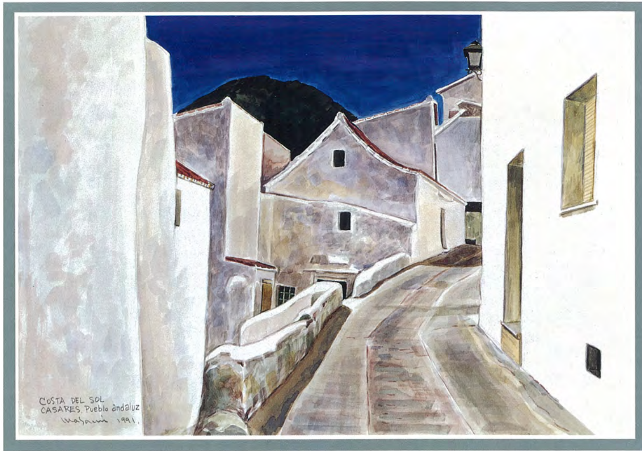
カサレスの白い家 杉浦正美 画