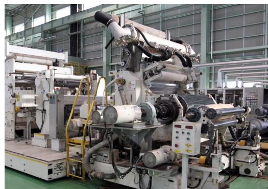
フィルム・シート製造装置

教育・研修：新入社員研修、語学研修、部門別研修、階層別研修、 国内・海外留学・派遣研修 他